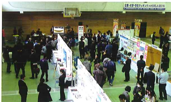
※昨年度の企業・大学・学生マッチングinHIMEJIの様子

企業・大学・学生マッチングinHIMEJI開催5周年を記念し、兵庫県立大学等のこれまでの産学連携の成果発表のためのパネル展示特設コーナーを設置します。