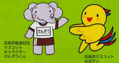
兵庫県健康財団 マスコット キャラクター けんぞうくん