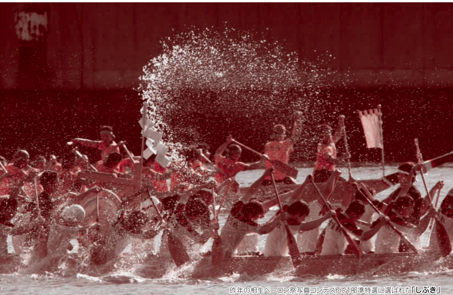
昨年の相生ペーロン祭写真コンテストで1部準特選に選ばれた「しぶき」

発行所 相生商工会議所 兵庫県相生市旭3丁目1-23 TEL.0791-22-1234(代) FAX.0791-22-2290