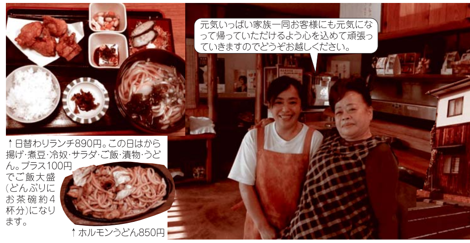
↑日替わりランチ890円。この日はから揚げ・煮豆・冷奴・サラダ・ご飯・漬物・うどん。プラス100円でご飯大盛(どんぶりにお茶碗約4杯分)になります。 ↑ホルモンうどん850円

でも最後の一粒まで口に運んでしまう美味しさです。 夜はホルモンうどんが人気で、しょうゆべーすの味付けで意外とあっさり食べられます。 宴会には15名の奥座敷もあり、予算に応じた対応されますので、これからの忘年会・新年会シーズンにも是非ご予約ください。 ◆姉妹店情報◆ 旭の関西電力さん横には「手打ちうどん播匠」も営業中。うどん好きの方はぜひ一度ご賞味ください。カレーうどん・チキンカツ定食が人気です。平日11:30~14:00営業(土日祝日定休)