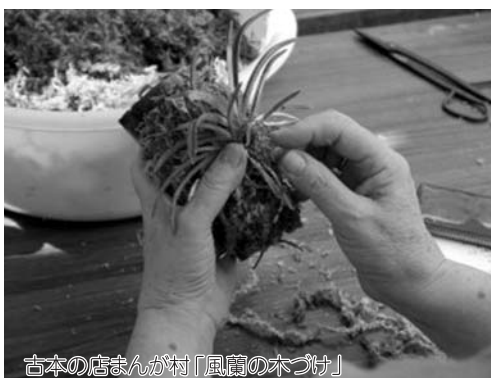
吉本の店まんが村「風鳥の木づけ」

ながら、お店やスタッフを覚えて頂く事のできる事業です。小売業の方はこちらも、様々な業種の方のご参加をお待ちしております。詳細は同封のご案内をご覧ください。