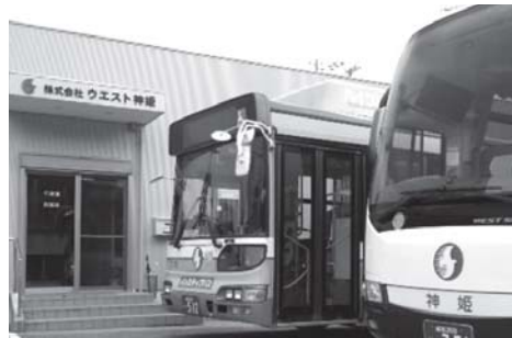
株式会社ウエスト神姫社屋とバス