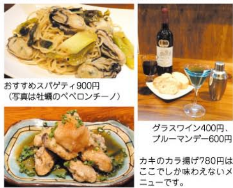
おすすめスパゲティ900円 (写真は牡蠣のペペロンチーノ)