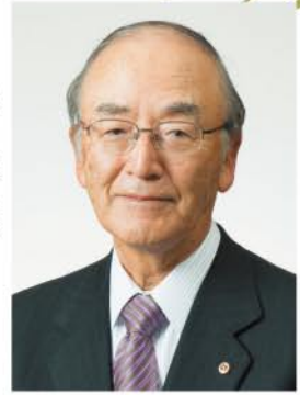
日本商工会議所 会頭 三村 明夫