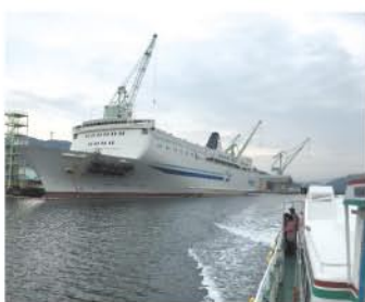
船上からIHIの工場を見学。穏やかな播磨灘の自然も満喫していただきました。

今年もたくさんの方に相生市へお越しいただきました。11月18日(土)あいおい白龍城主催「ど根性大根大ちゃん祭」に協賛し、相生湾クルージングを実施しました。これは、船上から相生の産業(相生湾の工場)と自然を見学していただく「相生の地域資源を活かした産業観光ツーリズム事業」として実施したもので、当日はあいにくの空模様ながら、延べ126名の方にご乗船いただきました。ガイドをIHIのOBの方にお願ひし、IHIの工場群とクレーンなどの巨大設備を丁寧解説していただきました。また万葉岬などの瀬戸内海国立公園を海上から眺めることができ、参加者皆様に大変喜んでいただきました。